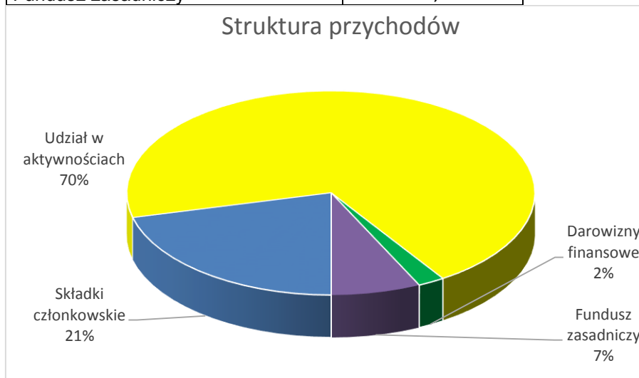
Wykres 1 Struktura przychodów