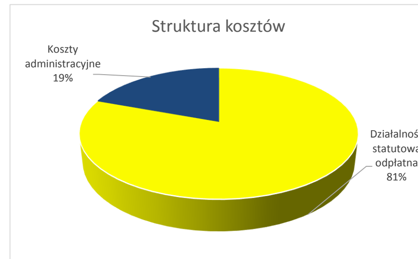
Wykres 2 Struktura kosztów