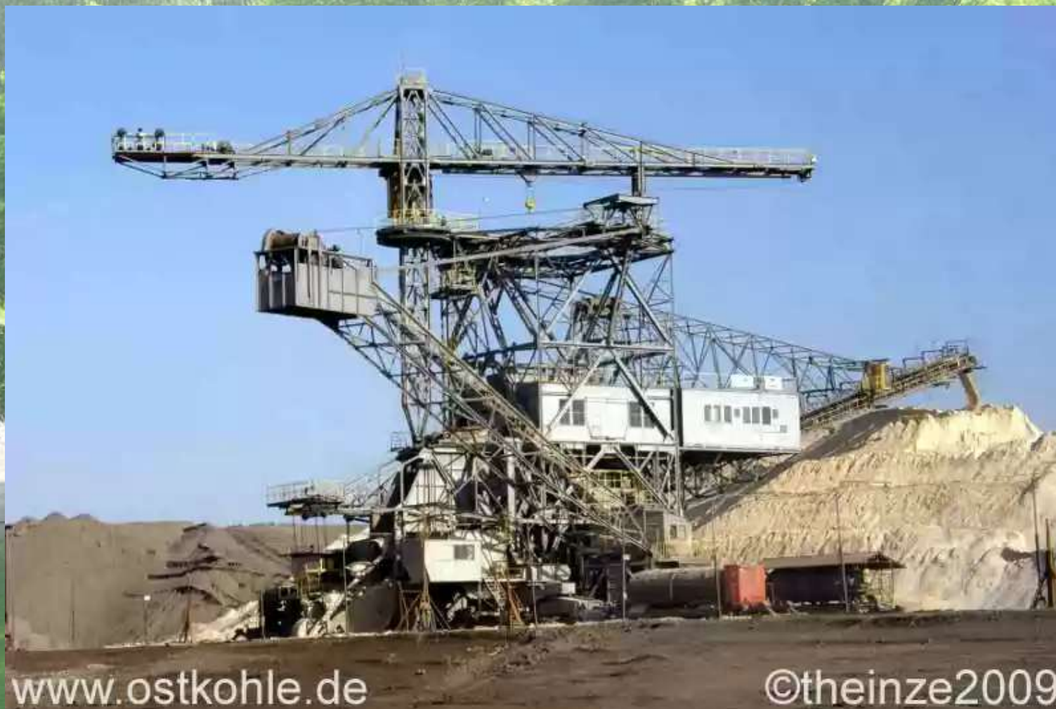
Briesing – Kopalnia odkrywkowa węgla brunatnego – Punkt widokowy