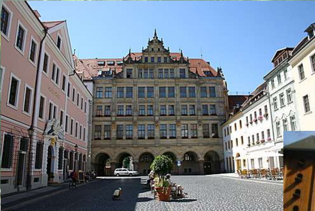
Goerlitz – Architektura renesansowa