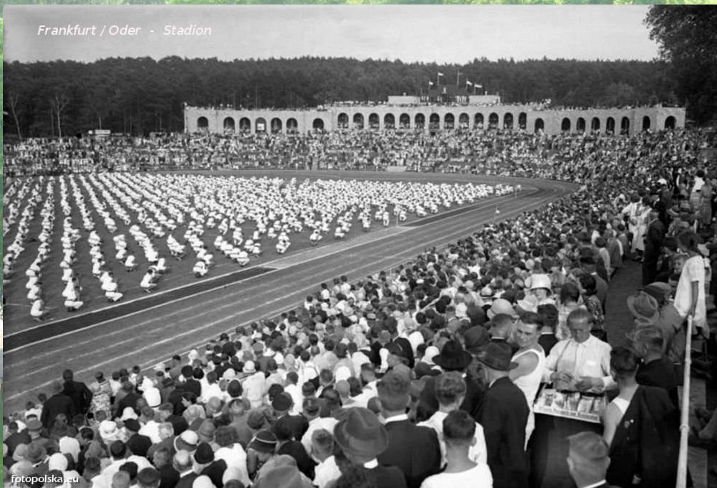
Stadion Olimpijski w Słubicach