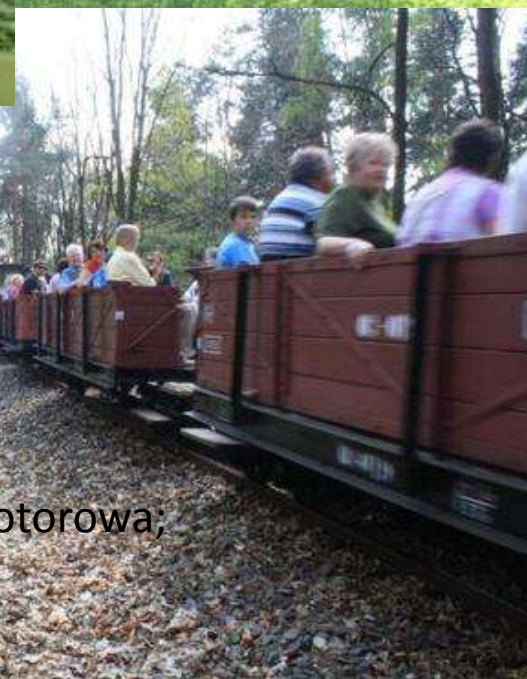
Bad Muskau - Park rododendronów , Zabytkowa kolejka wąskotorowa;