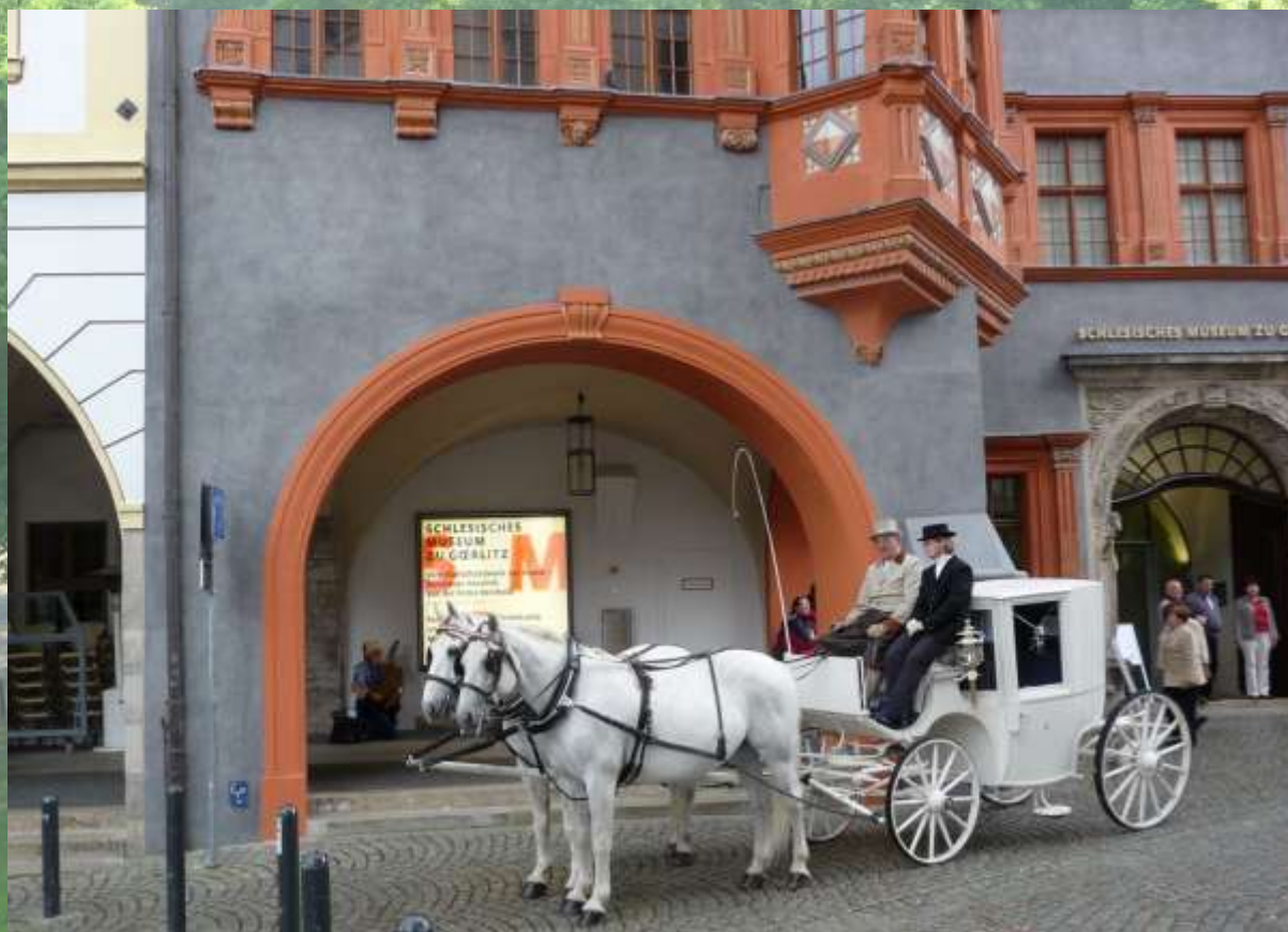
Goerlitz – Muzeum Śląskie