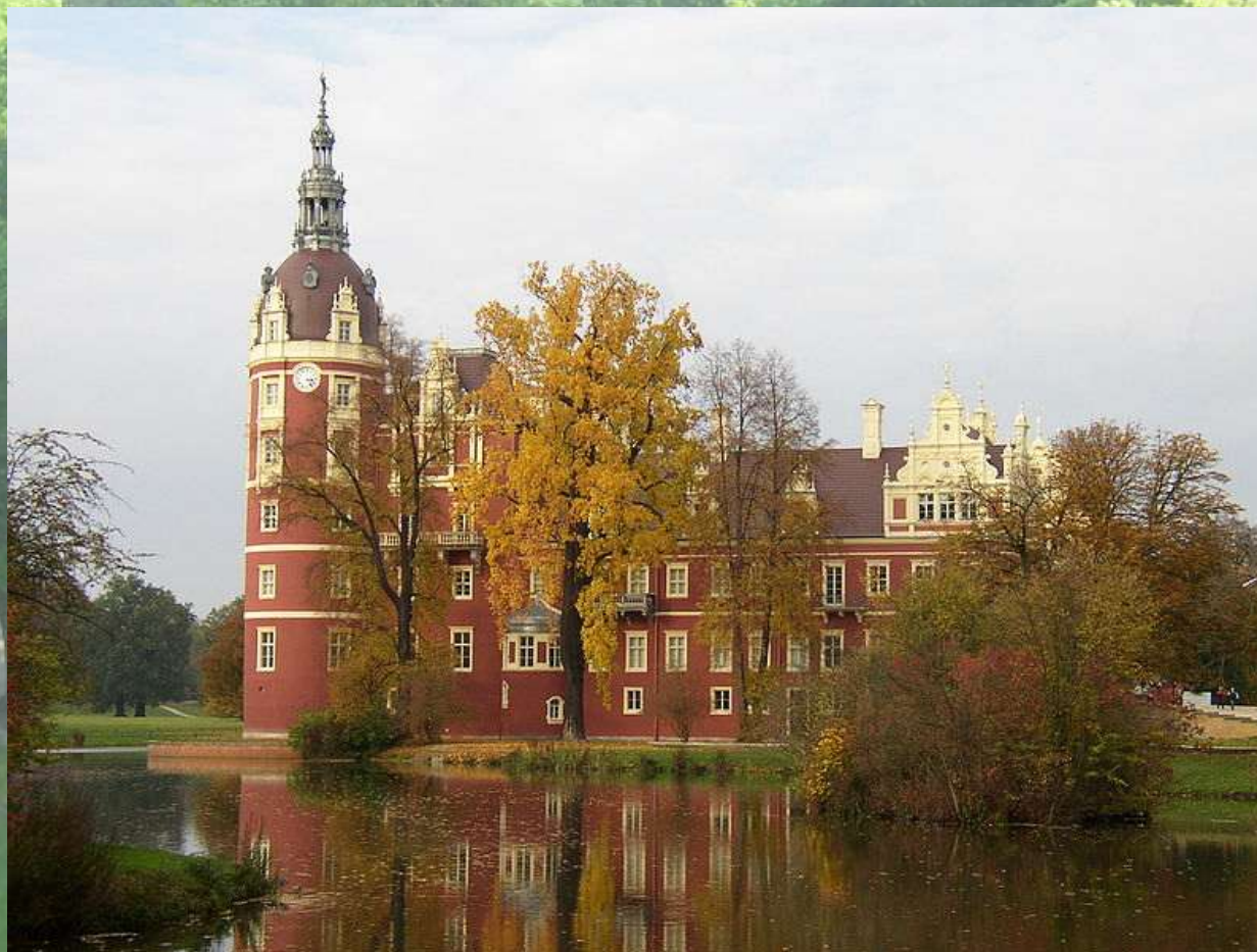
Bad Muskau – Park Mużakowski/ Fuerst-Puckler Park