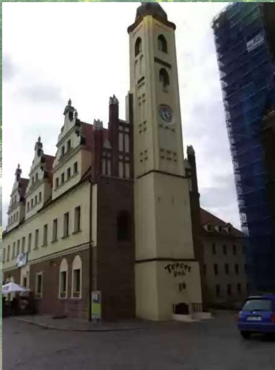
Guben - Ratusz