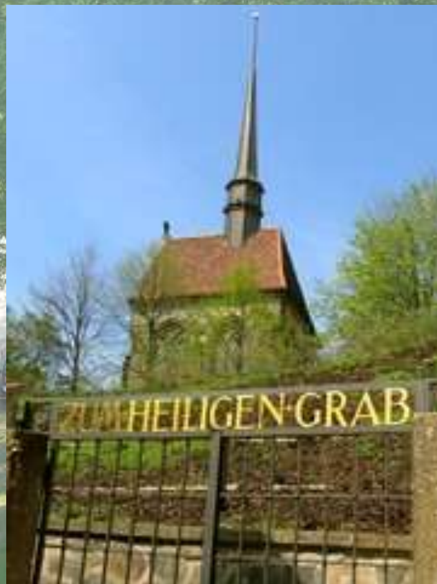
Goerlitz – Święty Grób