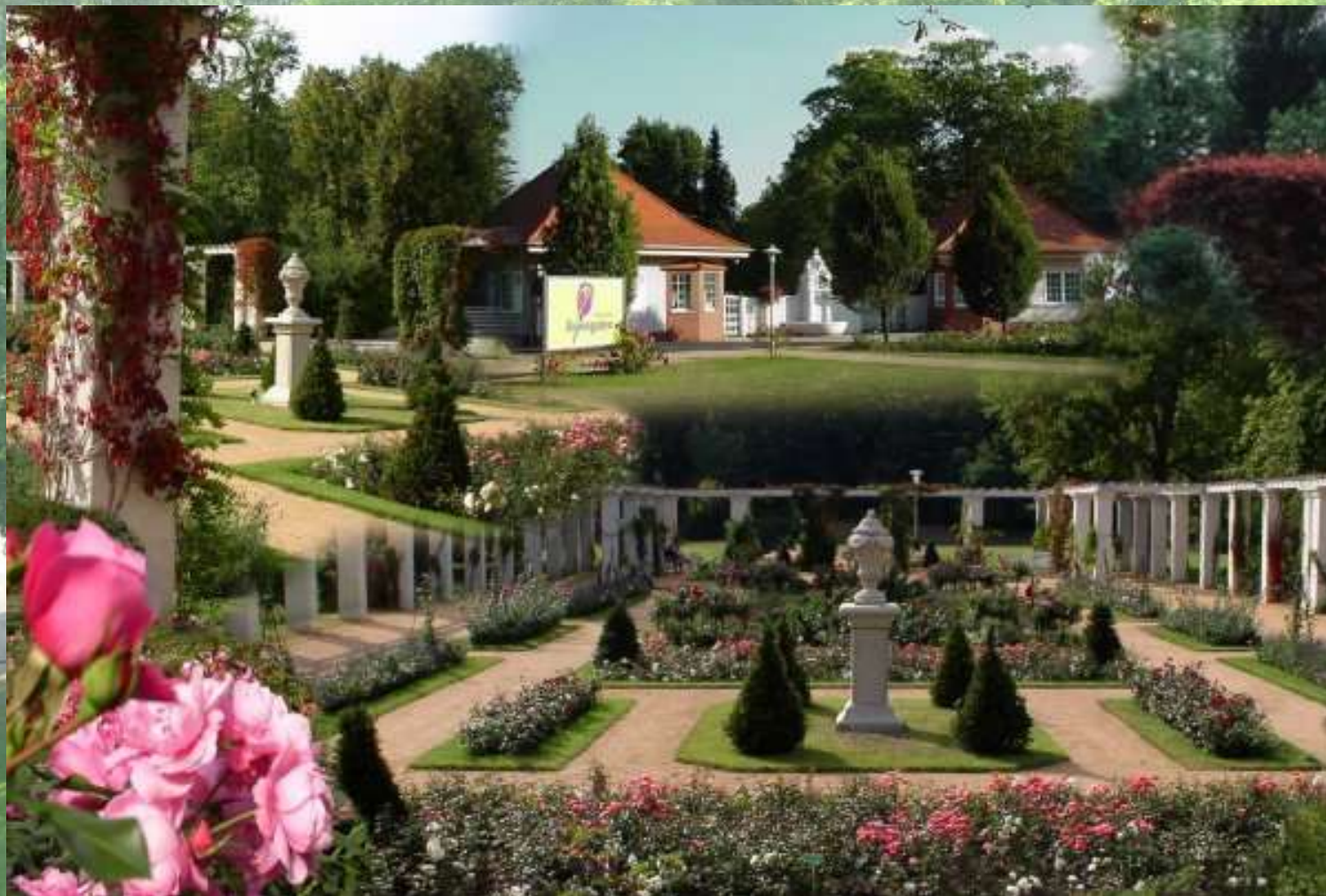
Forst – Miasto Róż