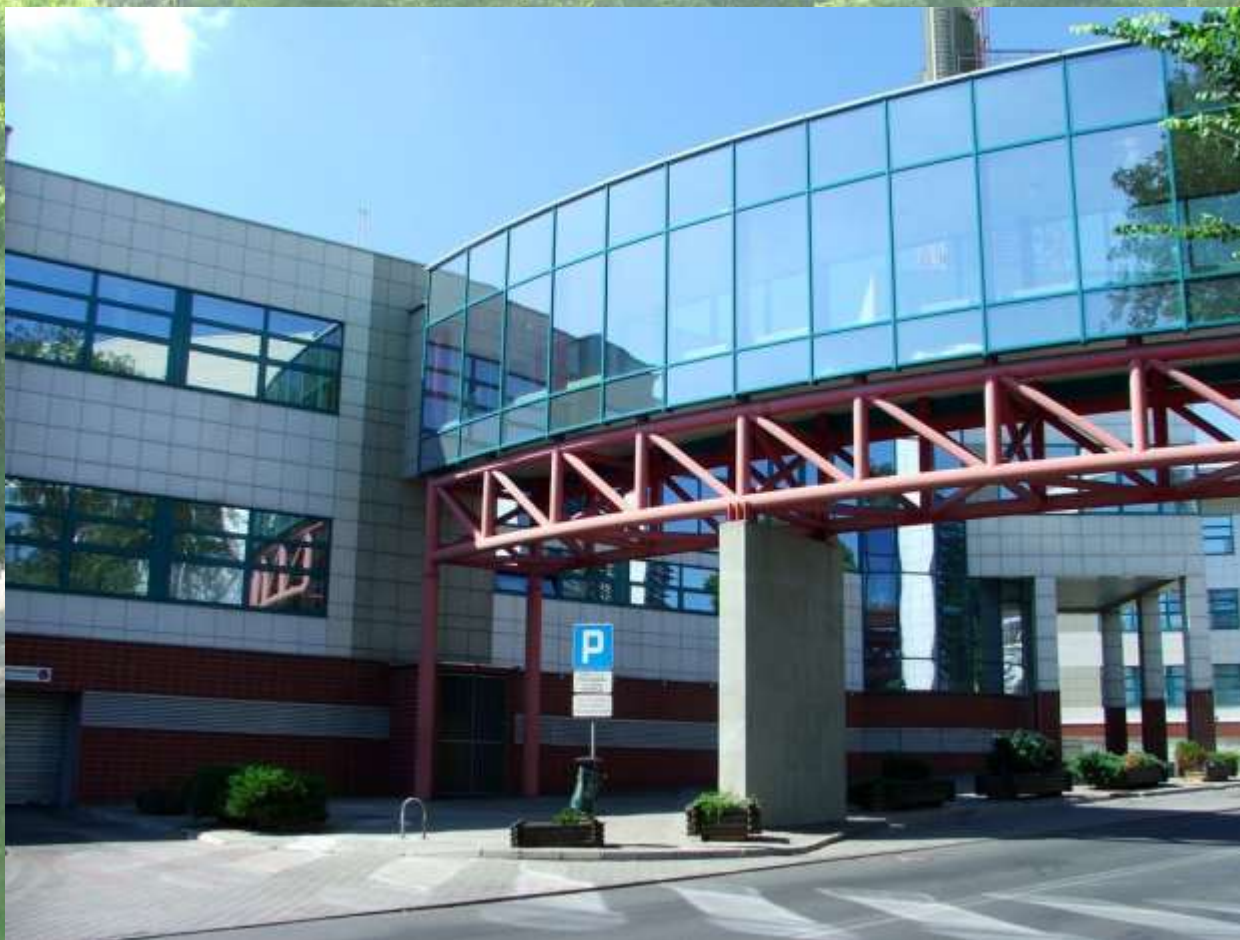
Słubice – Collegium polonicum