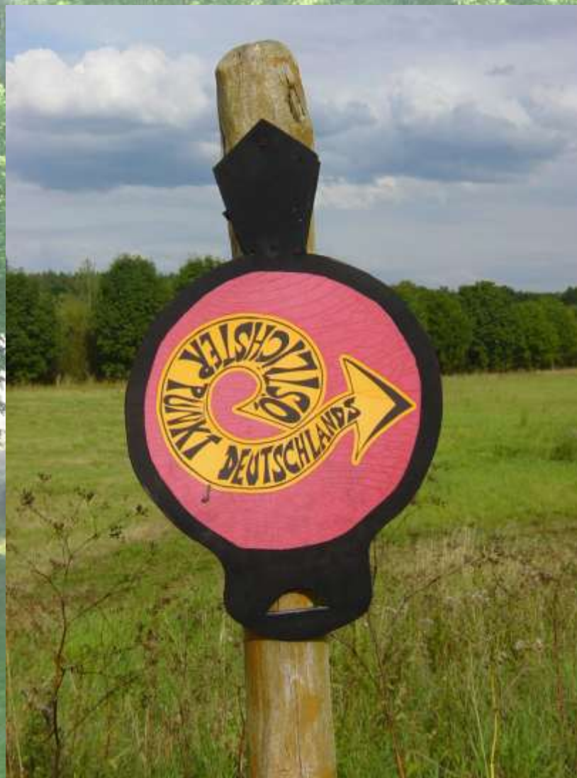
Zentendorf – najbardziej wschodni punkt w Niemczech