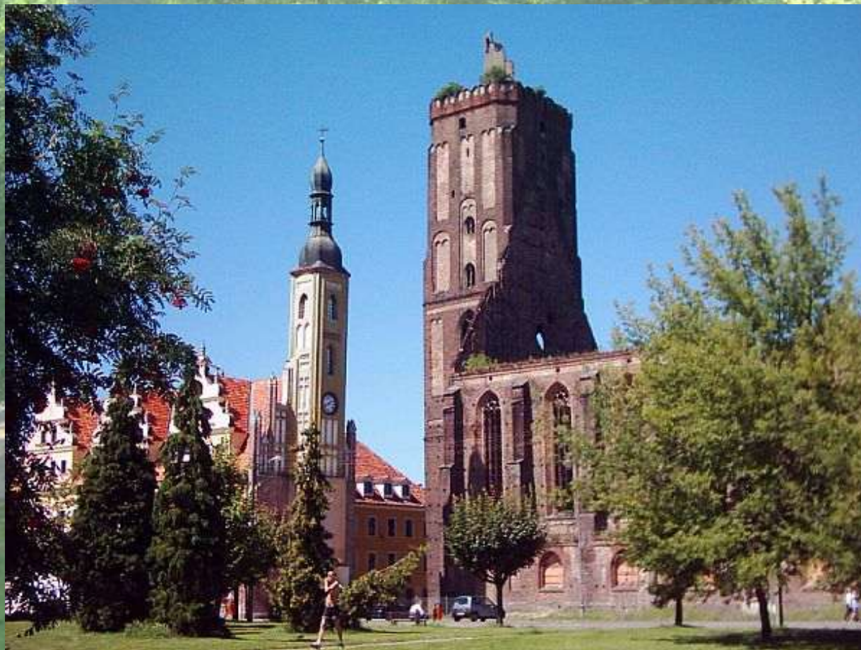
Ruiny Fary Guben/Gubin