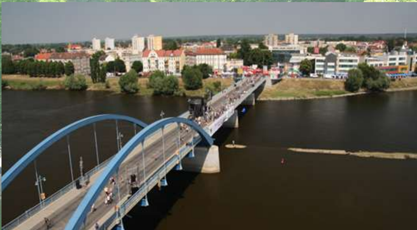
Panorama Słubic od strony Frankfurtu nad Odrą