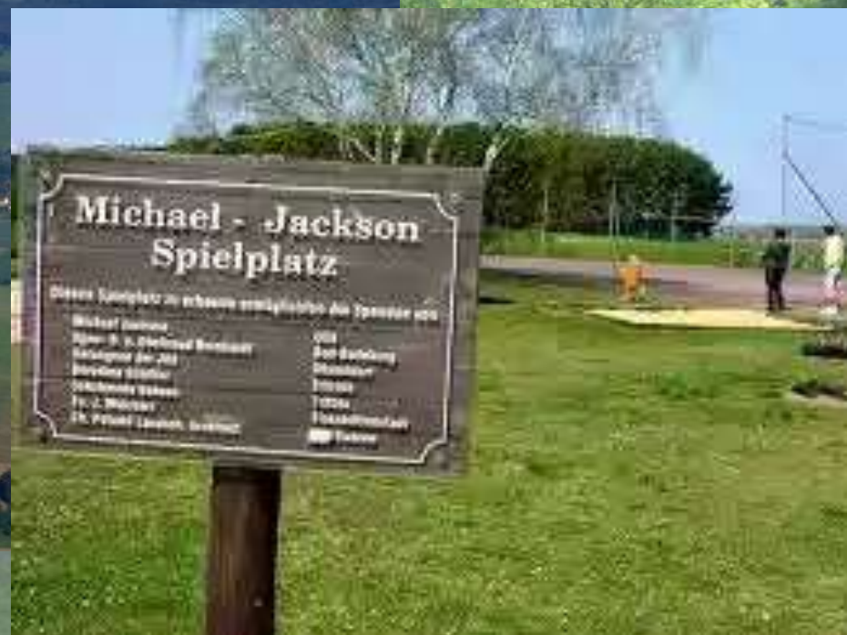
Ratzdorf – Krzesiński Park Krajobrazowy, Ujście Nysy Łużyckiej do Odry