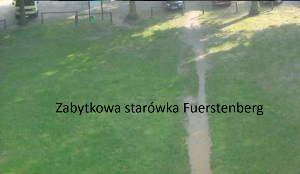
Zabytkowa starówka Fuerstenberg