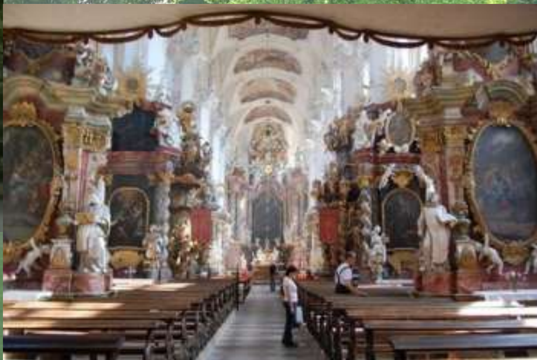
Zespół klasztorny Neuzelle