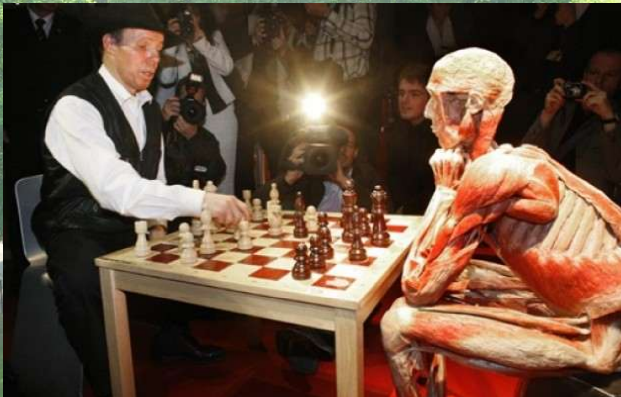
Guben - Plastinarium