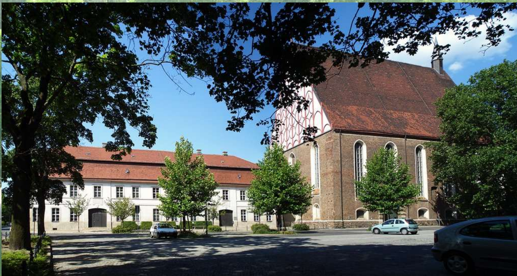
Sala koncertowa im. Karola Filipa Emanuela Bacha we Frankfurcie