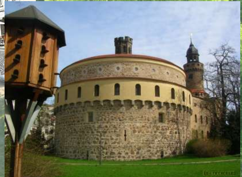
Goerlitz – Baszta Cesarska (1/32)